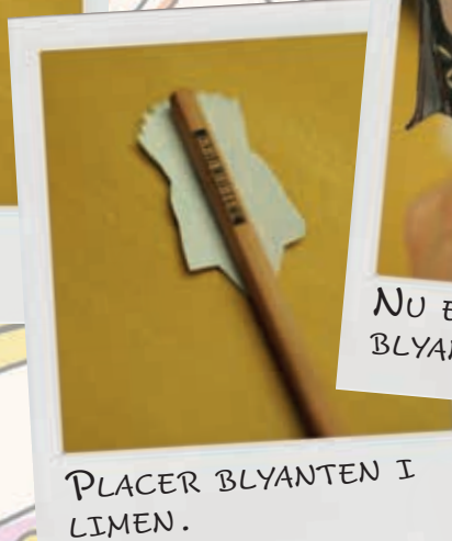
PLACER BLYANTEN I LIMEN.