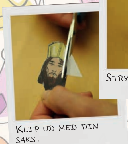
KLIP UD MED DIN SAKS.