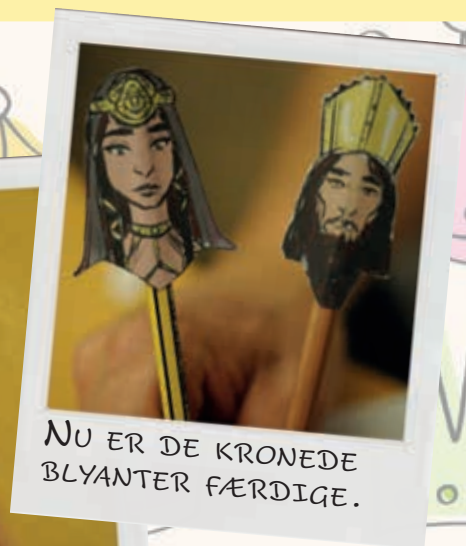
NU ER DE KRONEDE BLYANTER FÆRDIGE.